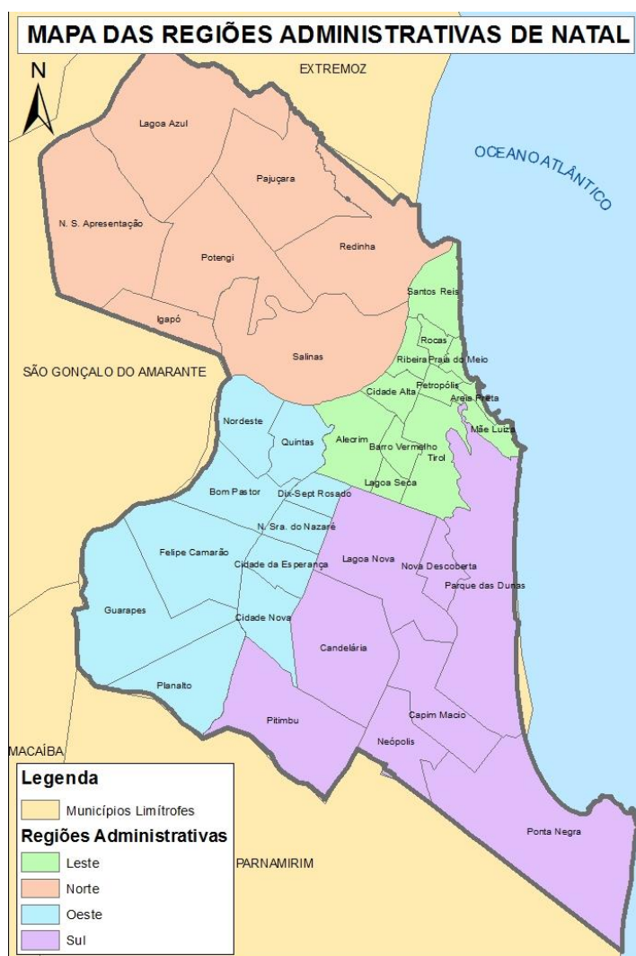
Figura 1. Mapa das Regiões Administrativas de Natal

O território municipal é dividido em 36 bairros, agrupados em quatro regiões ou zonas administrativas, conforme apresentado nas Figuras a seguir.